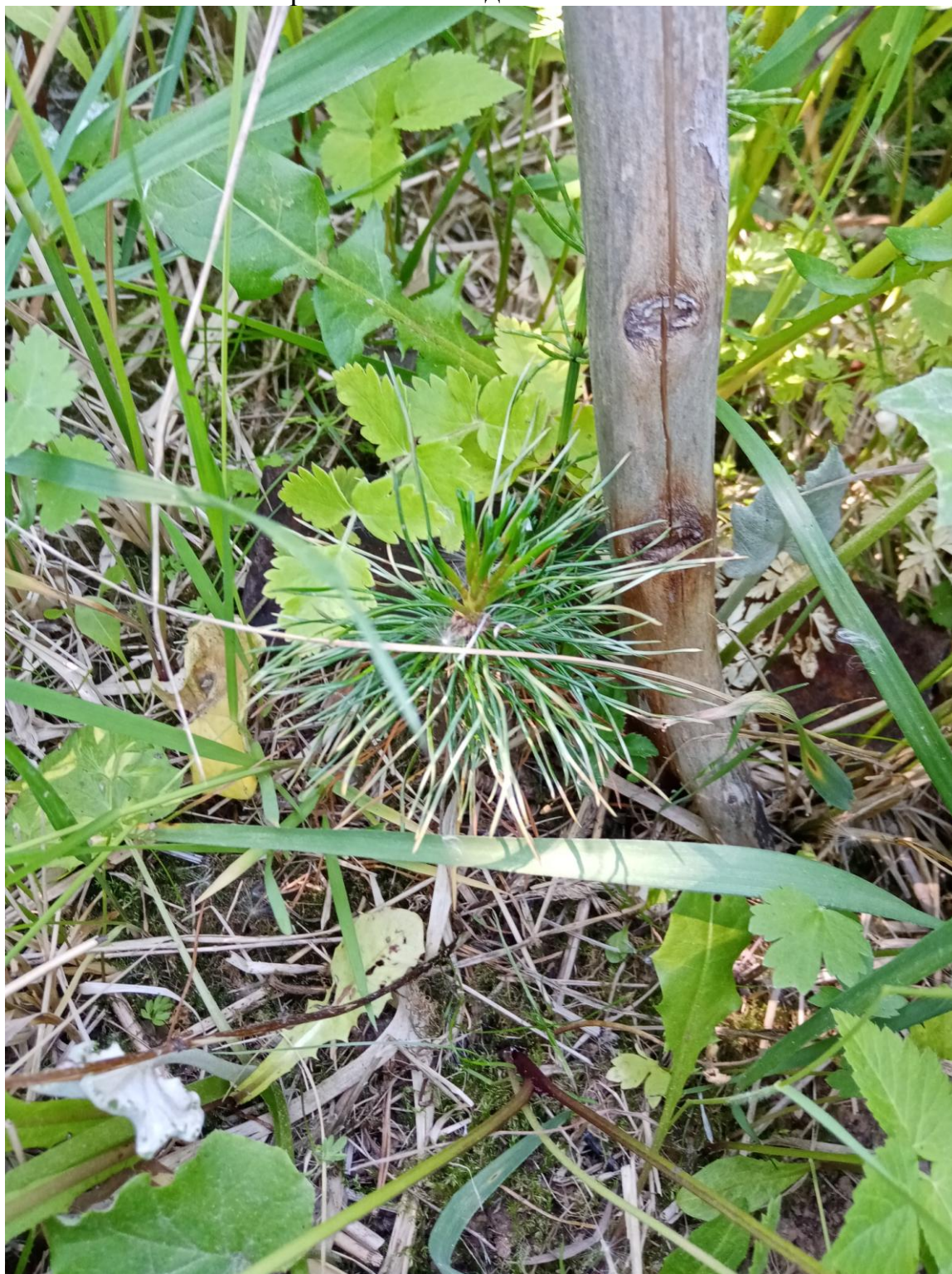
Рис. 1. Высажены деревья весной 2019 года в д. Емельяново Вологодского района Вологодской области