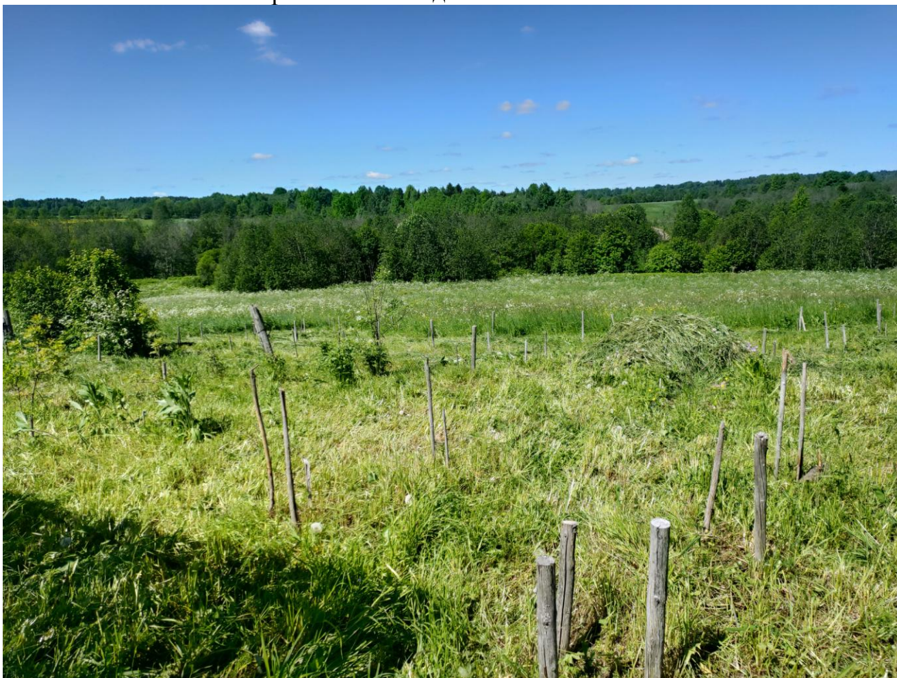
Рис. 1. Высажены деревья весной 2017 года вблизи д. Зуево Вологодского района Вологодской области