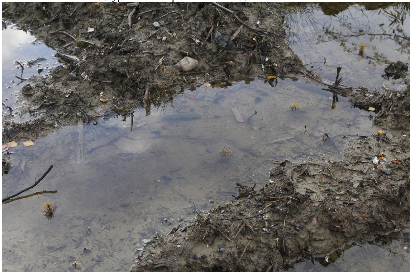
Рис. 1 Затопленные территории. Высажены саженцы весной 2019 года вблизи р. Сухона, Междуреченский район Вологодской области